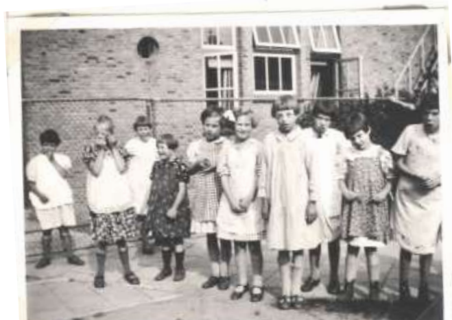
Gefotografeerd in de speeltuin

De besten hielpen met het opmaken van de bedden, maakten de groenten schoon en verder werd er veel gehandwerkt. Eenmaal in de week kwam de pastoor catechismus leren, wat door enkelen nog werd opgenomen en begrepen!