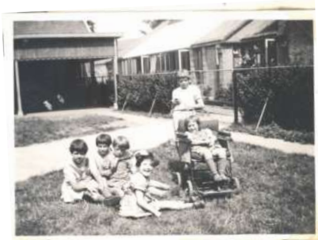
Op deze photo is de achterkant van het "Maria-paviljoen" goed te zien.