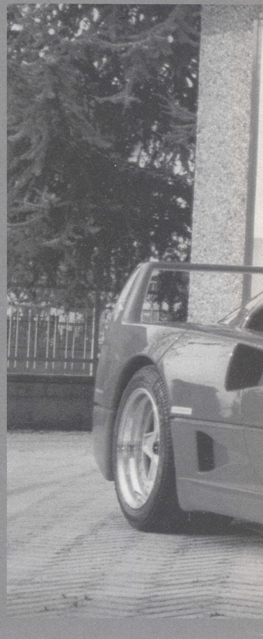
Leerlingen ROC Utrecht en een Ferrari

Een van de oorzaken van het achterblijven bij het hoger onderwijs is het feit dat de bve-sector nog maar zeer recent is ontdekt als 'internationaliseringsmarkt'. Werkgevers beginnen te beseffen dat ook het middenkader en lager personeel 'iets met internationalisering' moet doen, o.a. onder invloed van de ict-ontwikkelingen. Maar de impuls vanuit het bedrijfsleven is nog erg zwak en ongericht. Mbo'ers worden in meerderheid opgeleid voor het midden- en kleinbedrijf en daar is de behoefte aan internationale ervaring