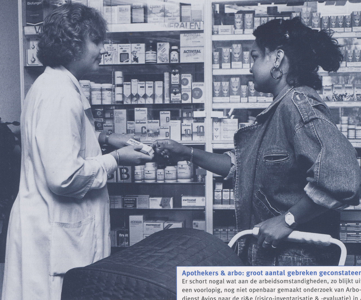
In apotheken werken voornamelijk vrouwen. Daar dient de wetgeving rekening mee te houden.

van de assistenten. Daardoor neemt bij hen ook de motivatie toe.