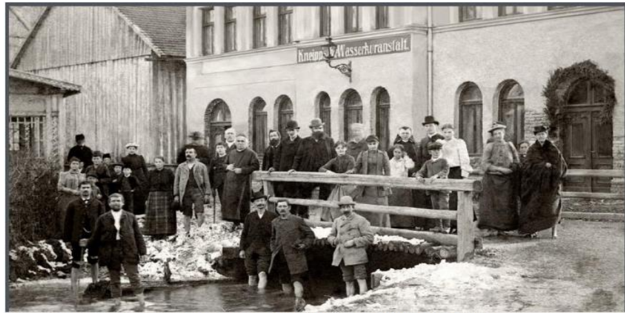
Pastoor Kneipp met calot – links – steunend op de brugleuning voor "Kneipp's Wasserkuranstalt".

Mede door de hoge oplages van zijn publicaties zochten velen genezing in Wörishofen. Kneipp beschikte over een indrukwekkende klantenkring, waaronder aartshertog Franz Ferdinand van Oostenrijk en zijn vader aartshertog Karl Ludwig. Paus Leo XIII verleende pastoor Kneipp de eretitel van pauselijk geheim-penningmeester in 1894. De paus werd door Kneipp behandeld tijdens diens bezoek aan Rome. Tussen 1889 en 1897 kwamen er maar liefst 3.000 logeerbedden in Wörishofen beschikbaar. De kuur behoorde tot de traditionele Europese geneeskunde. 9 Sebastian Kneipp onderscheidt zich echter ook fundamenteel van andere voorstanders van natuurlijke therapieën. Zo nodig adviseerde hij ook om vaccinatie en medicatie toe te passen. Opvallend is ook de zeer gedocumenteerde diagnostiek, die Kneipp en zijn medici hanteerden 10 . Ook probeerde hij erkenning te verwerven door samen te werken met artsen die zijn behandeling ondersteunden 11 . Mede daardoor werd de Kneippkuur enigermate geaccepteerd in de medische wereld, ondanks de controversie die er bestond tussen de moderne geneeskunde (allopathie) en de "kwakzalverij" van de 'Natural Cure Movement'. 12 Kneipp breidde de definitie van gezondheid uit met een meer holistische kijk die mentale, sociale en spirituele aspecten omvatte.