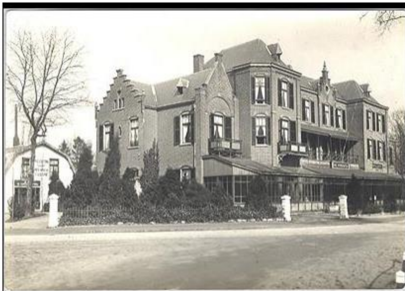
Hotel Bad Wörishofen in de Duivelsbruglaan (Stedelijk Museum Breda)