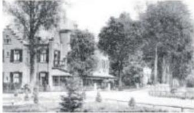
Bad Wörishofen voordat het gebombardeerd werd.