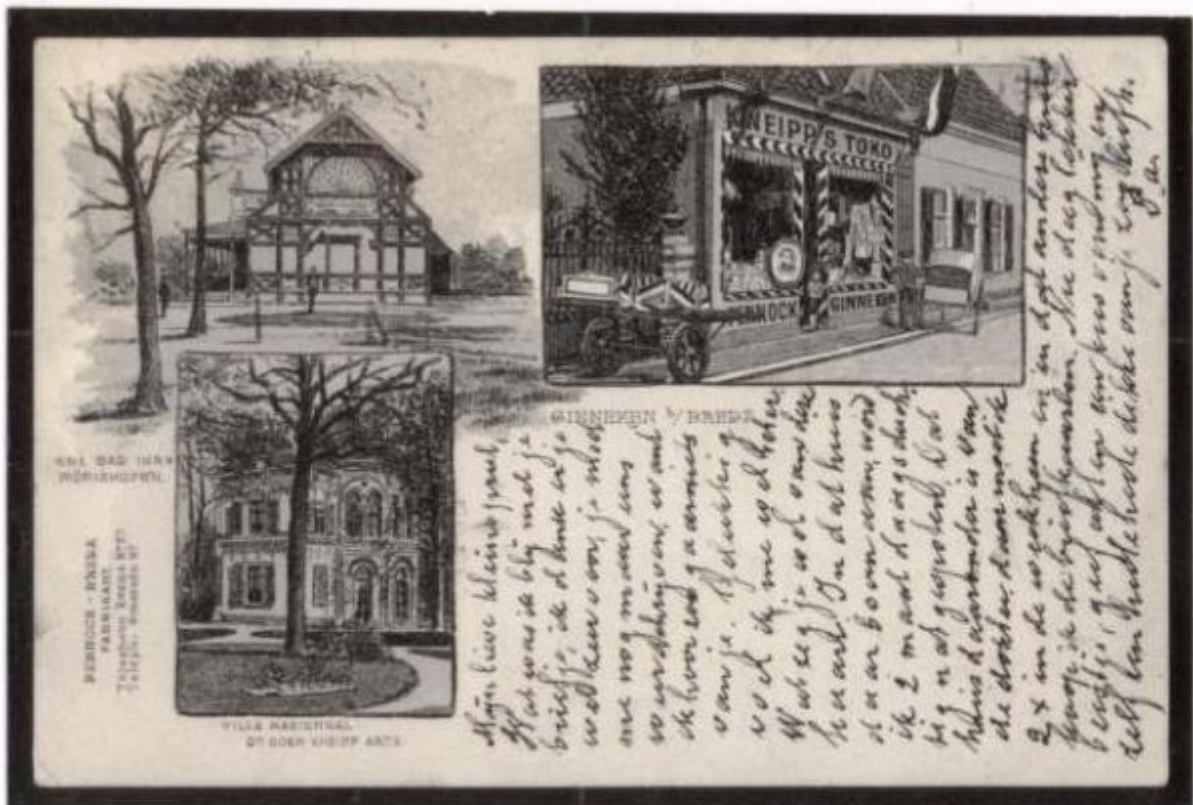
"Kneipp's Toko" – Toko is een "winkel" in het Maleisisch / rsp. Nederlands Indische spraakgebruik. 90