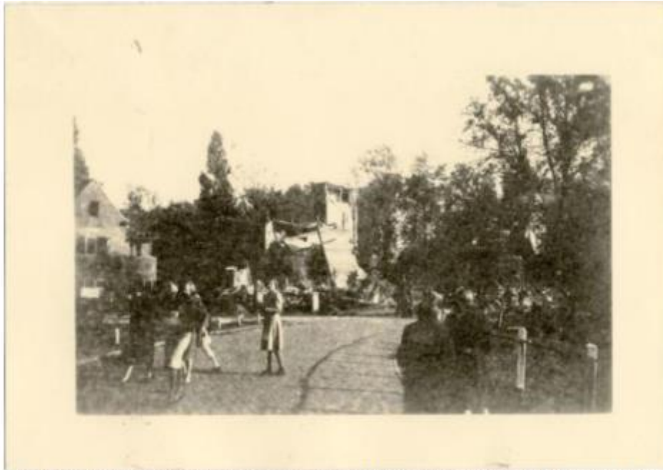
Oorlogsschade "Bad Wörishofen" te Breda na een geallieerd bombardement (13 okt 1944).