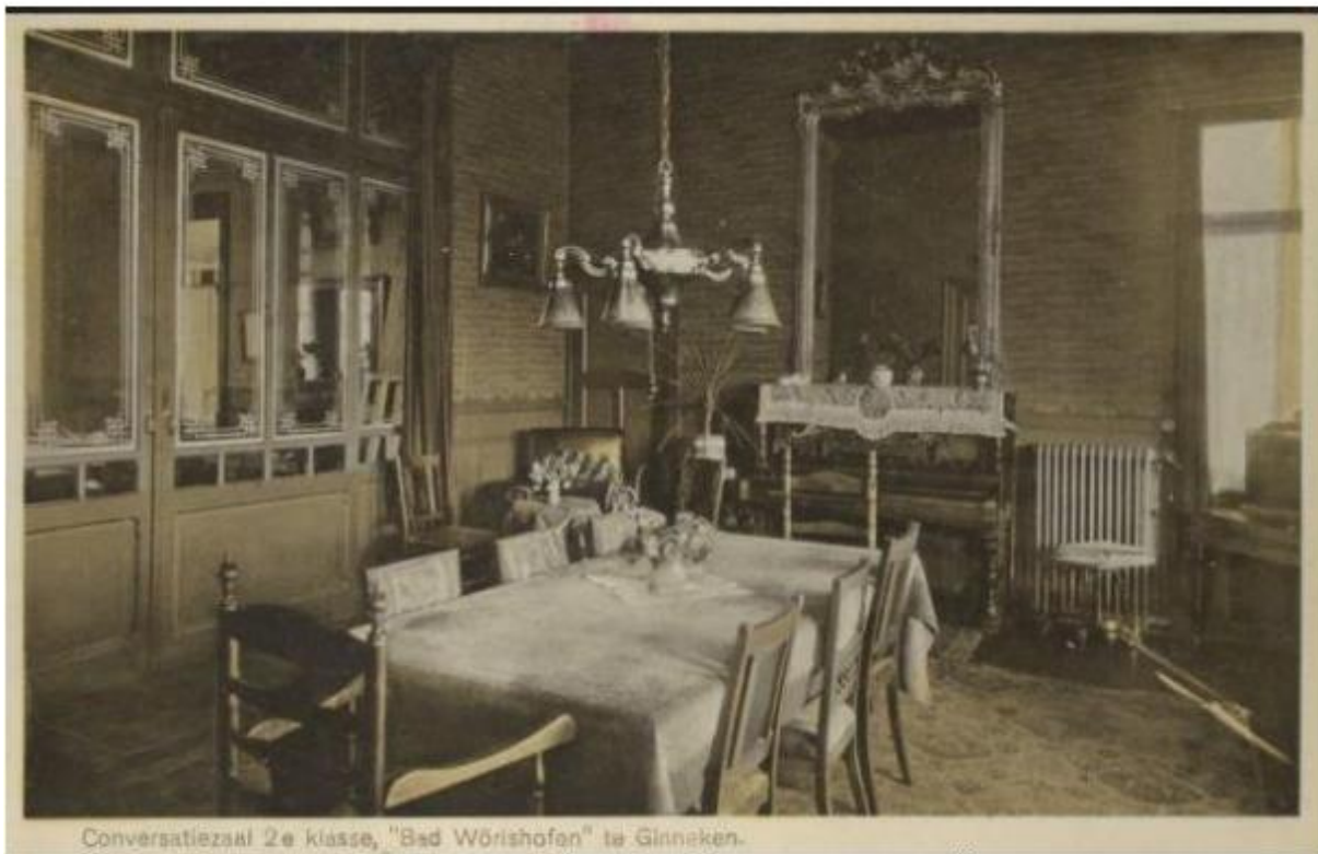
Conversatiezaal 2e klasse, "Bad Wörishofen" te Ginneken.