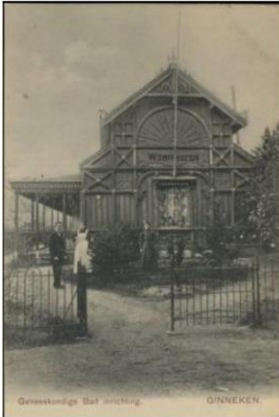
Geneeskundige Bad inrichting.