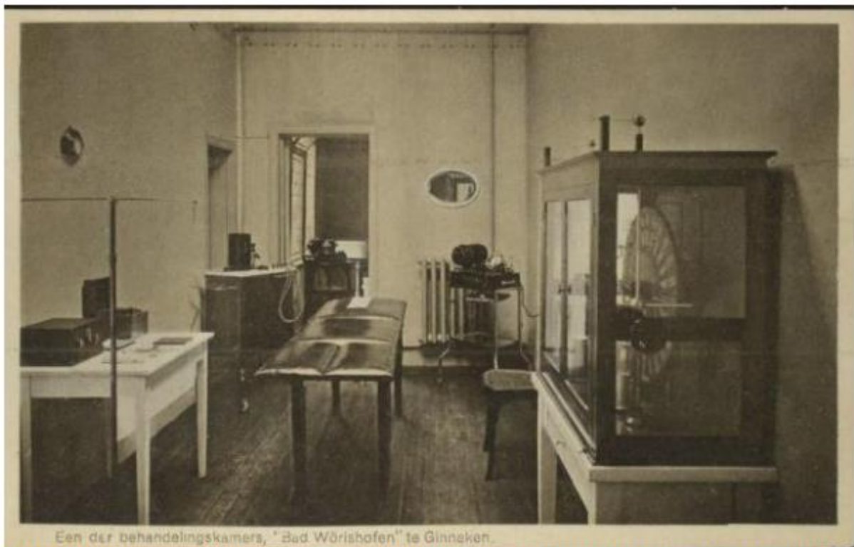
Een der behandelingskamers, "Bad Wörishofen" te Ginneken.