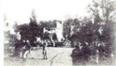
Bad Wörishofen na het bombardement,