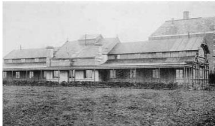
19. Een zeldzame foto van Bad Wörishofen, gebouwd in 1893 tegenover het Mastbos. In het gebouwje werden kuren gegeven volgens de geneesmethode van pastoor Kneipp. Foto, afkomstig uit het album dat in 1918 aangeboden werd aan Dr. Soer bij diens 25-jarig jubileum als Kneipparts te Ginneken.

Pas in de tweede helft van de twintigste eeuw komen antibiotica beschikbaar, waardoor de genezing van tuberculose mogelijk werd zonder de soms jarenlange ligkuren in de buitenlucht. Tot op heden is TBC één van de grootste en besmettelijkste ziekten in de wereld. 1 In 1882 werd de tuberkelbacil ontdekt door Nobelprijswinnaar Koch, werkzaam in het Charité Ziekenhuis te Berlijn. Pas 54 jaar later, in 1936, ontdekte Flemming de werking van antibiotica, waarna in 1943 de eerste antibiotica als geneesmiddel beschikbaar kwamen. De massaproductie startte in de vijftiger jaren. Tot die tijd werden allerlei geneeswijze toegepast die nu als 'kwakzalverij' kunnen worden bestempeld. Uit dit gebrek aan effectieve therapieën werd in 1893 de Ginnekense Kneipp-inrichting 'Wörishofen' gesticht, op de hoek van de Baronielaan en de Duivelsbruglaan. De instelling werd opgericht door