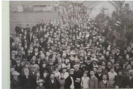
pastor Kneipp en zijn 'badgasten'

Mede door de grote oplages van zijn boeken groeide Kneipps faam in Europa. Zijn benadering vloeide voort uit de theorie dat alle ziekten hun oorsprong vinden in de bloedsomloop. Deze stemde overeen met de humorale theorie. Kneipp beweerde dat het inademen van 'miasmatische' (ongezonde), of overmatig hete, lucht kan leiden tot onbalans in het bloed, wat weer kan leiden tot een circulatiestoornis en ziekte. Kneipps aanpak bestond eruit dat waterkuren het bloed reinigen. 7 Vreemde stoffen lossen op, het bloed reinigt zich van deze miasmatische materie en het lichaam sterkt zich als geheel aan. Naast de hydrotherapie bestond de holistische Kneippkuur uit principes zoals gezonde voeding, kruidenremedies, lichaamsbeweging en innerlijke balans. 8