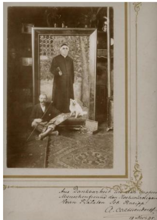
De Nederlandse kunstschilder Abraham Calissendorff (1853 – 1898) verbleef waarschijnlijk vanwege TB-ziekte in Wörishofen tussen 1895 en 1897. Hij schilderde een portret van Kneipp in 1895 13 .