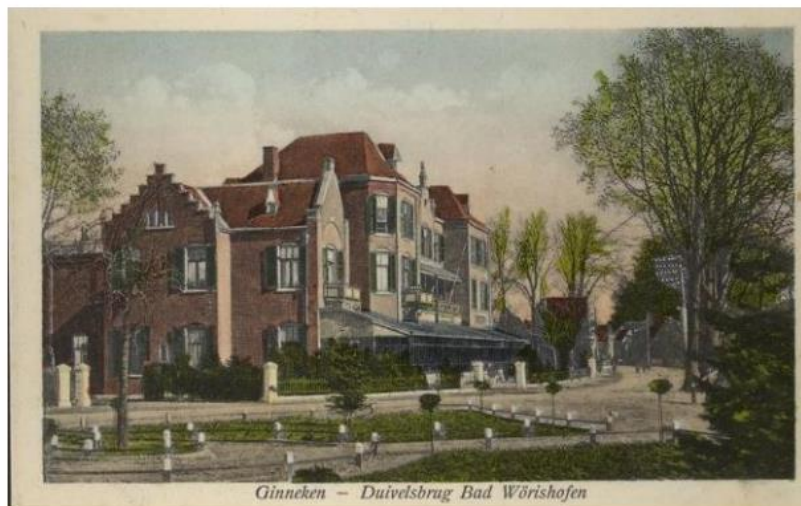
Ginneken – Duivelsbrug Bad Wörishofen Hotel Bad Wörishofen in de Duivelsbruglaan