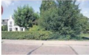
De herdenkingsplaquette komt aan de Duivelsbrug in het Ginneken.